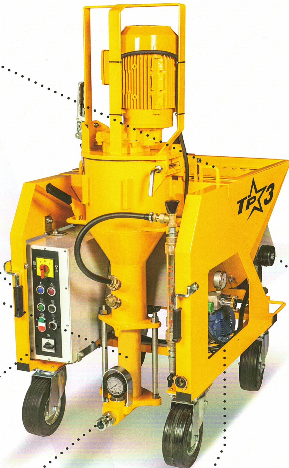
Collettore di uscita 25/35 e manometro