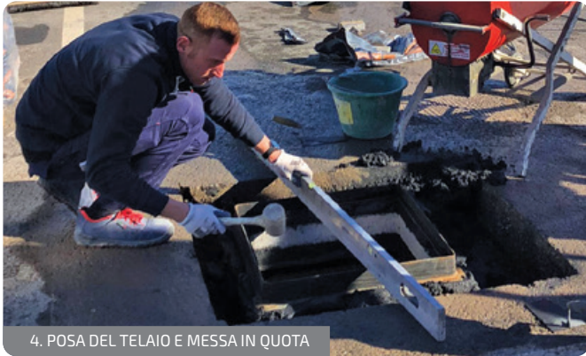
4. POSA DEL TELAIO E MESSA IN QUOTA