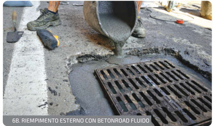
6B. RIEMPIMENTO ESTERNO CON BETONROAD FLUIDIDO