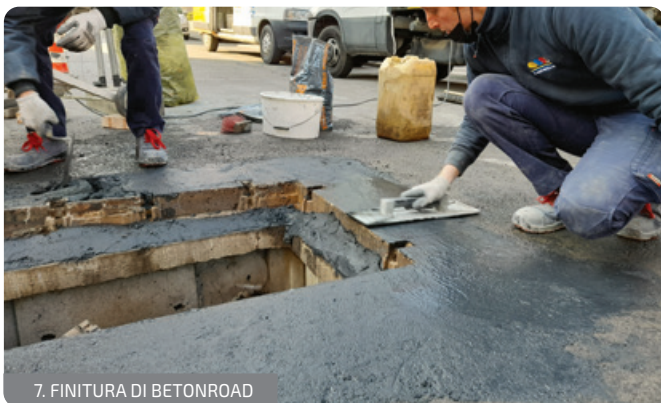
7. FINITURA DI BETONROAD