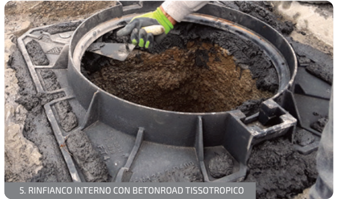
5. RINFIANCO INTERNO CON BETONROAD TISSOTROPICO