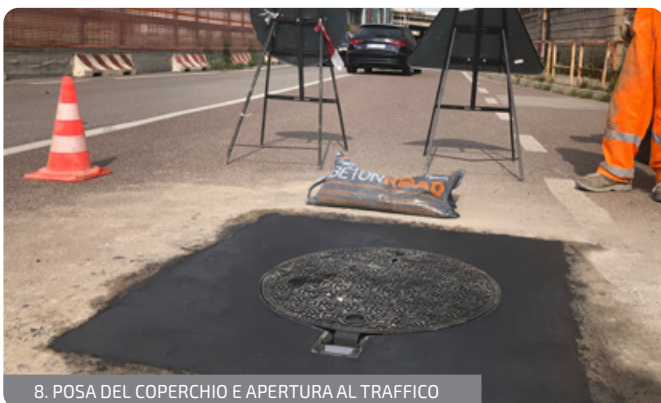
8. POSA DEL COPERCHIO E APERTURA AL TRAFFICO