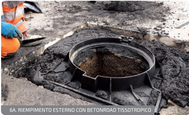
6A. RIEMPIMENTO ESTERNO CON BETONROAD TISSOTROPICO